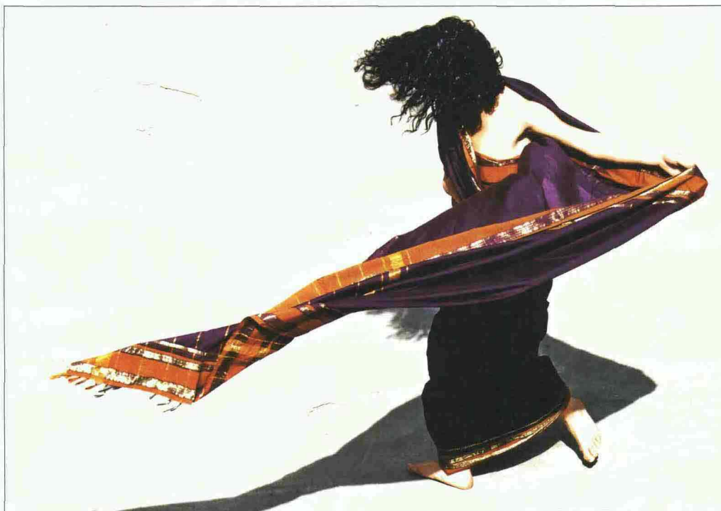
Trentino o Punjab? A Rovereto i colori di Codice India-Ineffabile stato di grazia, del gruppo Artemis danza.

F inalmente non si parla di loro basandosi su tonnellate di dati economici, usando termini come delocalizzazione e opportunità. Ma, semplicemente, si cerca di conoscerle incantandosi di fronte alla loro colta leggerezza, fatta di danze, suoni, colori. "Loro" sono India e Cina, e l'occasione per entrare nel cuore e nella fantasia dei due colossi asiatici è il Festival Oriente Occidente , l'appuntamento clou per il mondo della danza contemporanea che da ventott'anni va in scena in Trentino, tra Rovereto (auditorium Fausto Melotti), Trento (Teatro Sociale) e la valle di Sella (presso la Malga Costa,